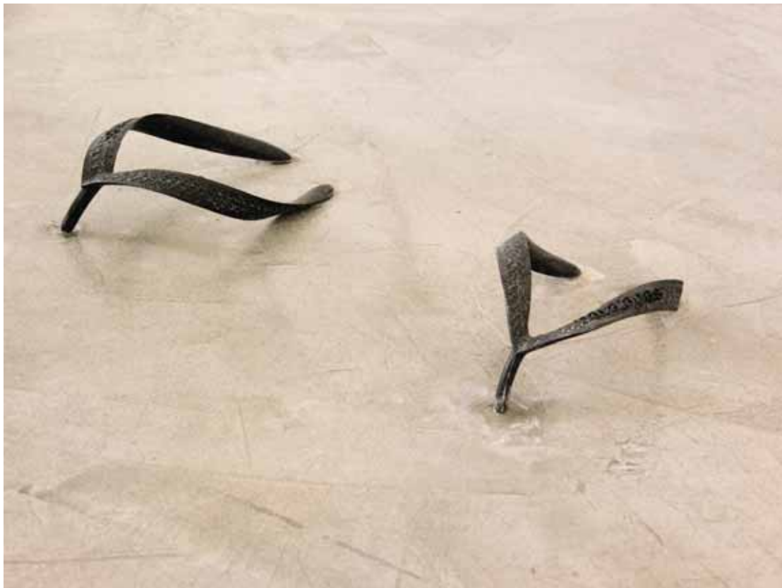
a destra: Leandro da Costa , Sem título , 2007, installazione, objeto de borracha tiras de chinelo, 28 x 20 cm