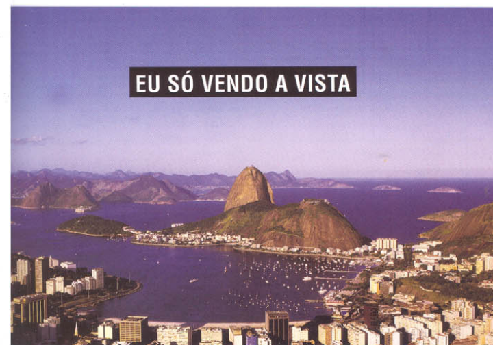
Marcos Chaves, EU SÓ VENDO A VISTA, 1988 (Foto Vicente de Mello) (Courtesy: Galeria Laura Marsiaj) © BURACOS, 1996/2000 (Courtesy: Galeria Laura Marsiaj)